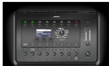
T8S EUR 899,- (ab April 18)