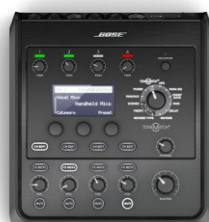
T4S EUR 579,-

Beide Pulte eignen sich zudem hervorragend für die Festinstallation, da der nicht geübte Anwender nicht durch viele Knöpfe irritiert wird.